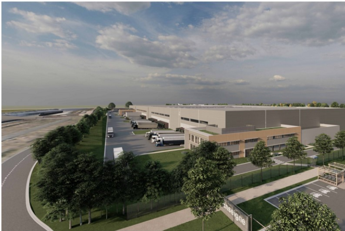
2 | Vue depuis la nationale 147 - direction Poitiers

Les zones paysagères représenteront 48 199 m 2 soit plus de 27% de la surface du lot.