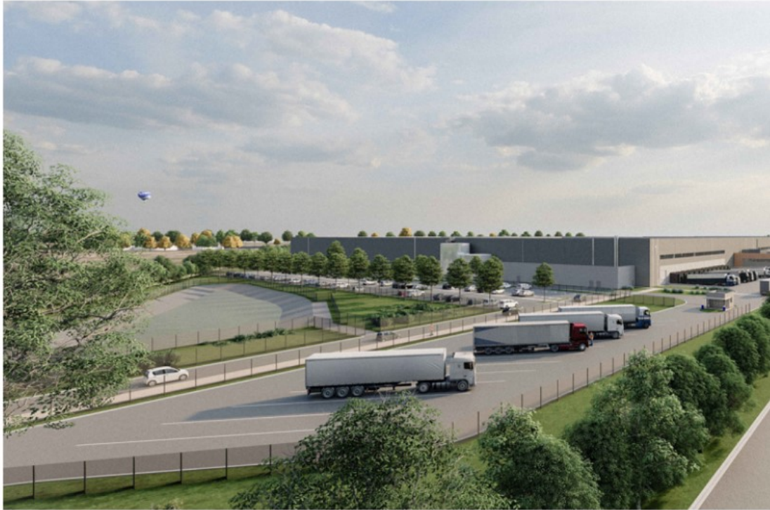
1 | Vue depuis l'entrée N°1